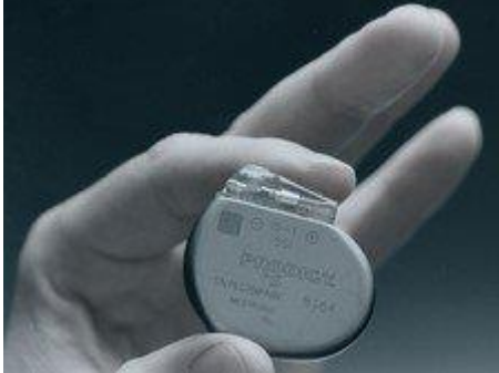
Kalp pili örneği

50 Hertz gibi düşük frekanslı elektromanyetik alanların sağlığı etkileyebilen eşik değerleri bilindiğinden, 'temel sınır değerler' Uluslararası İyonlayıcı Olmayan Radyasyondan Korunma Kurulu'nca (ICNIRP) belirlenebiliyor.