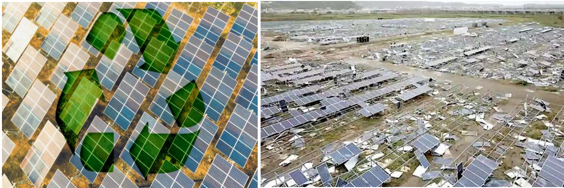
Şekil 1: Hurda panellerin geri dönüşümü gereği, Şekil 2: Bir tornado sonrası güneş panellerindeki yıkım

Dış basında – eğer güneş enerjisi söylendiği kadar temiz ise tüm dünyadaki milyarlarca paneldeki zehirli maddelerin ileride havaya, çevreye yayılması nasıl önlenecek ve panellerdeki diğer maddelerin geri dönüşümleri nasıl yapılacak? diye soruluyor ve bu sorun 10-15 yıl sonra patlayacak deniyor.